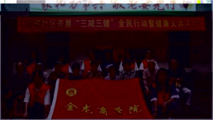
金龙商学院作为学校规模最大的二级学院，在教学、科研、实践活动等方面均表现出色。围绕晋江地区民营经济活跃、现代服务业专业群的区域

根据《中共福建省委教育工委关于开展“三全育人”综合改革试点工作的通知》（闽委教思〔2019〕11号），泉州轻工学院二级学院中金龙商学院党支部入围福建省“三全育人”综合改革试点院系（公示），是全省唯一一所入选的民办高校党支部，是对学校全面落实立德树人根本任务，全员、全程、全方位育人工作的肯定和鼓励！